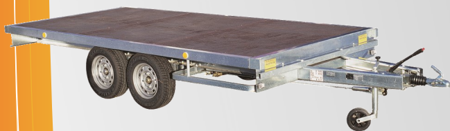
Roue jockey centrée